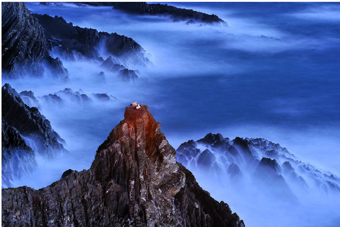
Las Damas del Mar. Francisco Mingorance